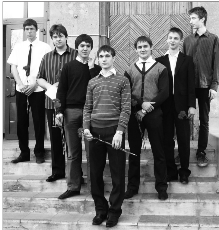
Хор юношей группы 11-3 на митинге