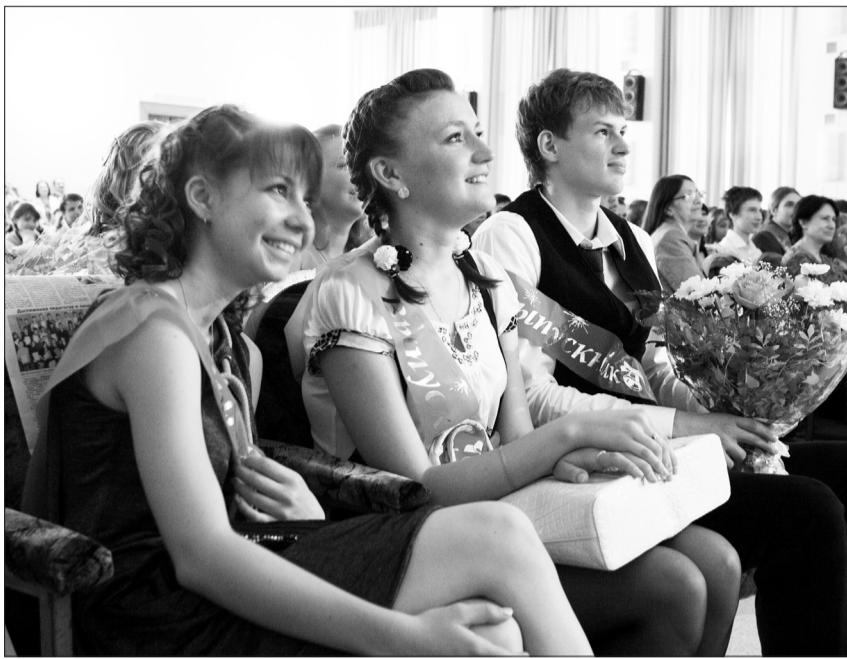
Старосты групп выпускных классов