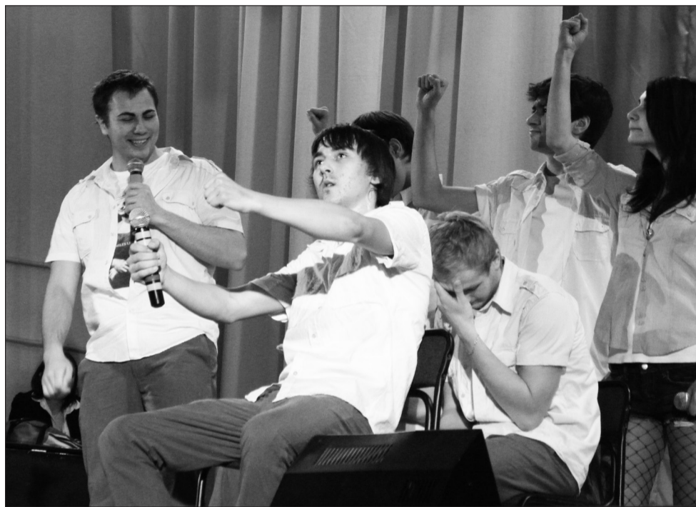
Выступает команда химико-металлургического факультета

сты с энергетиками – увлекательную сагу о путешествии Путина с конечной остановкой в Магнитке, занявшую первое место.