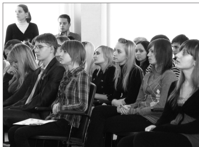
Старшеклассники школы № 1 на встрече с ректором МГТУ

ча настроена на то, чтобы помочь выбрать правильную профессию.