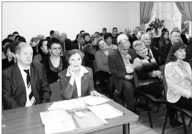
На учёном совете

Минувшее заседание учёного совета состоялось 24 ноября. В круг его основных вопросов вошло обсуждение образовательной деятельности университета и методического обеспечения новых специальностей и направлений подготовки.