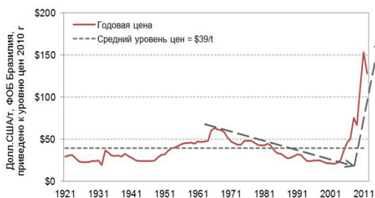
Рисунок 2 – Цена железной руды на мировом рынке в 2011 г.

мики рынка явилась строительная индустрия Китая, то цена на железную руду в 2011 году резко возрастает (рисунок 2). Фактором, определяющим рост цен на железную руду в 2011 году явился – рост спроса со стороны Китая, обусловленный политикой индустриализации и государственной программой по строительству железных дорог. Естественным образом, по окончании данного цикла в 2013 году цена на железную руду так же резко опускается.