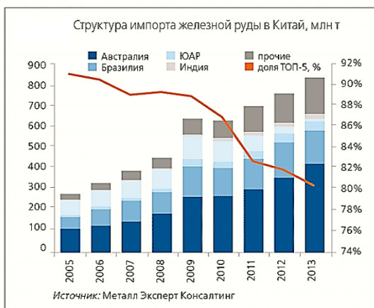
Рисунок 1 – Структура импорта железной руды в Китай за 2005–2013 гг.

мики рынка явилась строительная индустрия Китая, то цена на железную руду в 2011 году резко возрастает (рисунок 2). Фактором, определяющим рост цен на железную руду в 2011 году явился – рост спроса со стороны Китая, обусловленный политикой индустриализации и государственной программой по строительству железных дорог. Естественным образом, по окончании данного цикла в 2013 году цена на железную руду так же резко опускается.