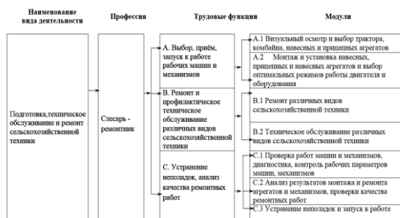
Рисунок 3 - Функциональная карта профессии

Требования стандарта относятся к виду экономической деятельности в сельском хозяйстве, по профессиям: слесарь-ремонтник, оператор животноводческих комплексов и механизированных ферм, техник-механик агропромышленного комплекса, техник по механизации трудоемких процессов. Пример функциональной карты по профессии «слесарь - ремонтники» представлен на рисунке 3[6].