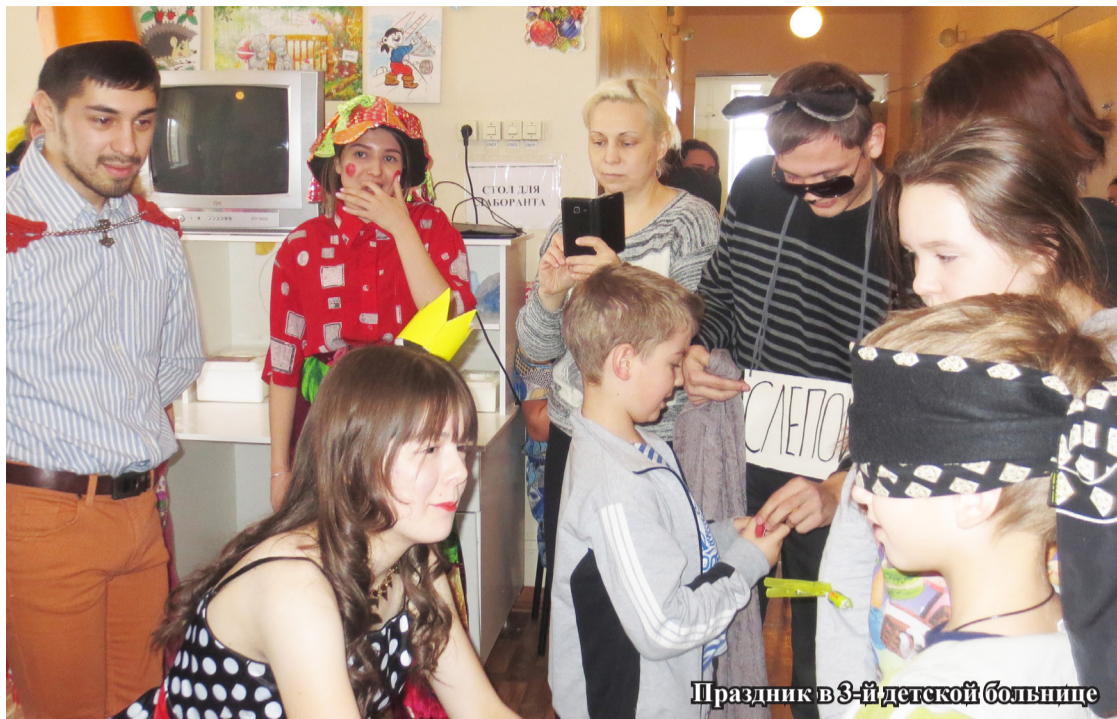
Праздник в 3-й детской больнице

Заявления и документы направлять по адресу: 455000, г. Магнитогорск, пр. Ленина, д.38, ФГБОУ ВО «МГТУ им. Г.И. Носова».