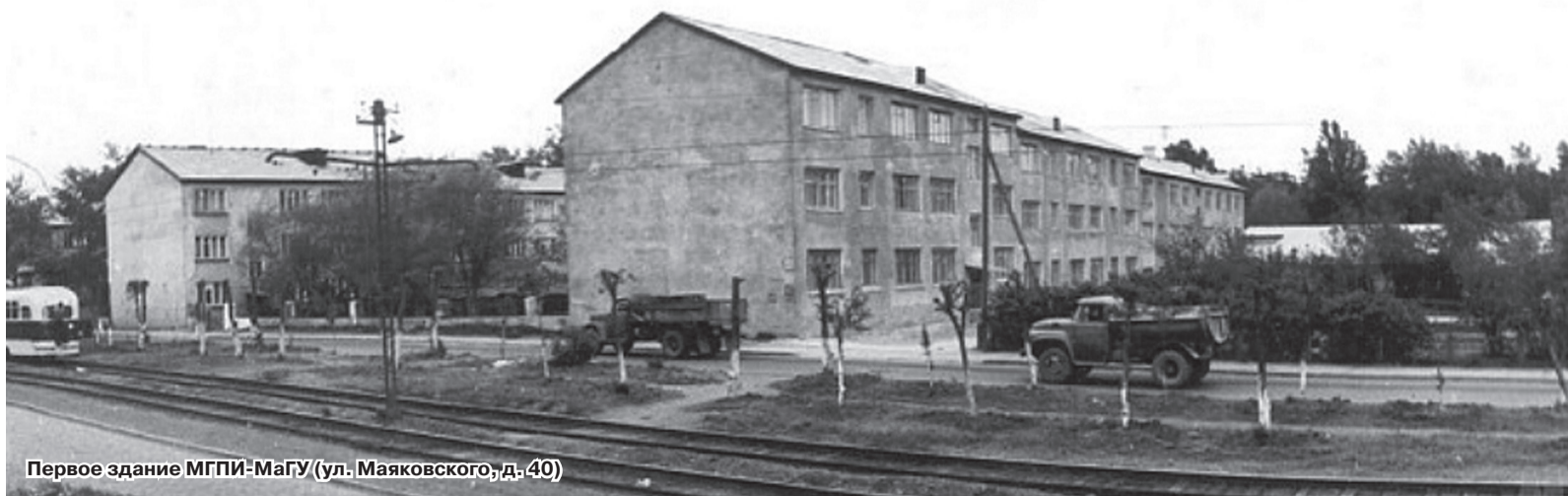
Первое здание МГПИ-МаГУ (ул. Маяковского, д. 40)