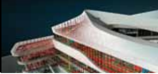
Autodesk Infrastructure Design Suite for Education