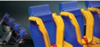
Autodesk Entertainment Creation Suite for Education