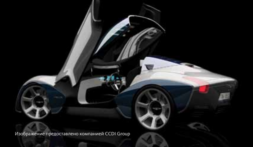
Изображение предоставлено компанией CCDI Group