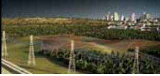
Autodesk Factory Design Suite for Education