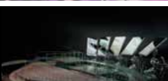
Autodesk Design Academy