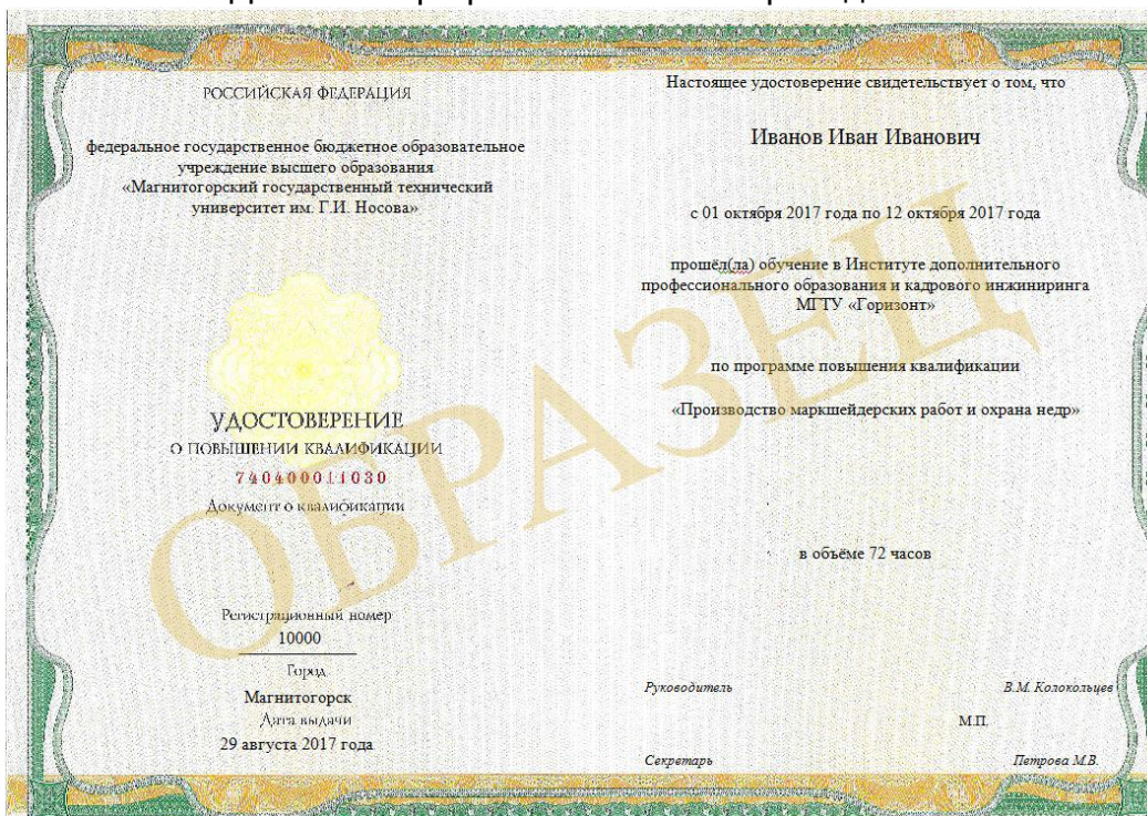
Удостоверение о повышении квалификации

ИДПО «Горизонт» 455026, Россия, Челябинская область, г. Магнитогорск ул. Дружбы 22/1, тел. (3519) 265-263, 265-110, 265-264, 421-315 сайт: idpo.magtu.ru, e-mail: idpo@magtu.ru