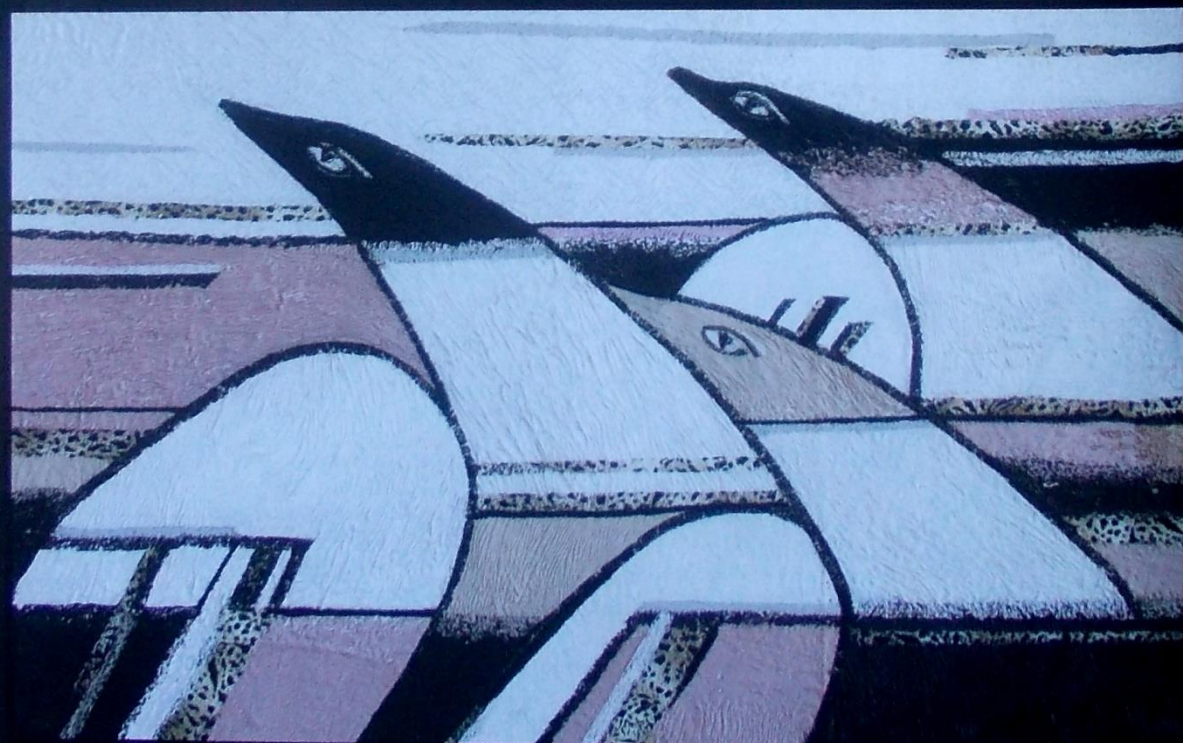
«Преодоление», выжигание по ткани, гофрирование, 2000.

В 1986 году Светлана поступает в МГПИ (ныне МаГУ) на художественно-графический факультет. Заканчивает его с красным дипломом, возвращается домой и работает преподавателем ИЗО и труда в детском саду. А через 2 года её приглашают на преподавательскую работу в родной институт. В настоящее время она доцент кафедры живописи факультета изобразительного искусства и дизайна МаГУ. Член Союза художников России с 1998 года. Активно участвует в художественных выставках с 1993 года: городские, региональная выставка «Урал» (г. Уфа, 1997), VI областная выставка преподавателей вузов (г. Челябинск, 1998), Всероссийская выставка (г. Москва, 1999), IX региональная художественная выставка «Урал» (г. Екатеринбург, 2003), Всероссийская художественная выставка декоративно-прикладного искусства «На радость Вам» (г. Москва, 2005), региональная выставка декоративно-прикладного искусства «Уральский мастер» (г. Курган, 2006).