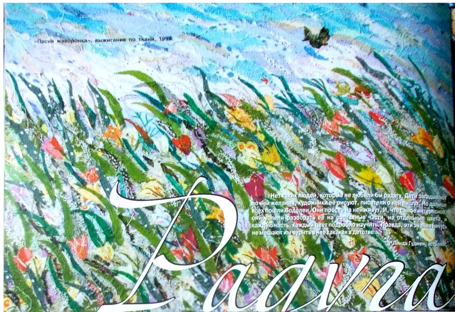
«Песни жаворонка», выжигание по ткани, 1999.

«Нет таких людей, которые не любили бы радугу. Дети загадывают по ней желания, художники её рисуют, писатели о ней пишут. Но дальше всех пошла Водолея. Они просто на ней живут. И, что самое интересное, они успели разобрать её на отдельные части, на отдельные цвета, и каждую часть, каждый цвет подробно изучить. Правда, эти знания ничуть не мешают им верить в неё так, как в детстве...»