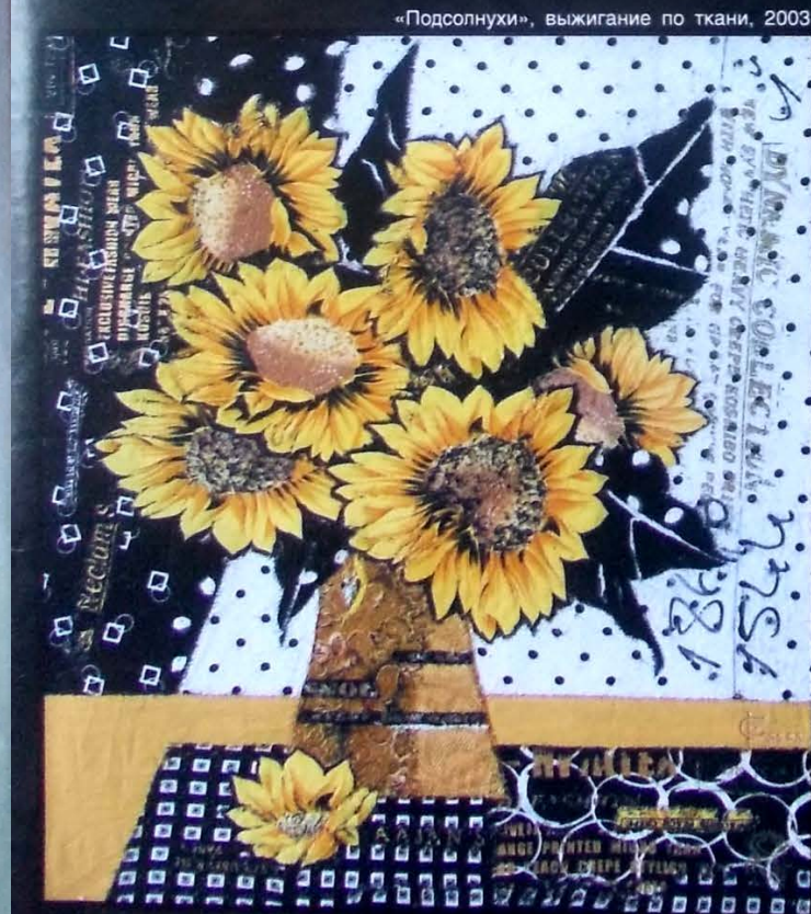
«Подсолнухи», выжигание по ткани, 2003.

нашли непосредственное отражение в творчестве художницы. Они материализовались во многих её работах, в которых колышутся травы, порхают бабочки, летают птицы, ярким цветом полыхают тюльпаны, и зритель на самом деле ощущает степные запахи, жаркое дуновение ветра («Полёт», выжигание по шёлку, вышивка; «Возвращение», выжигание по шёлку; «Преодоление», выжигание по шёлку и др.). Ритмически организованные композиции выразительны, красивы по цвету и наполнены глубоким смыслом.