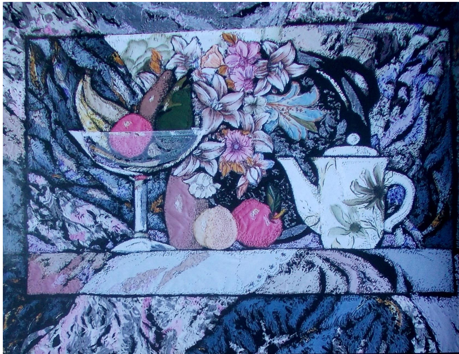
«Натюрморт с белым чайником», выжигание по ткани, 2000.