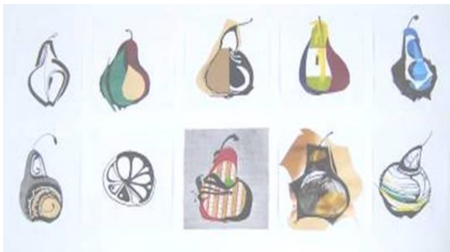
Рисунок 4. Пример стилизации и трансформации с введением тона и цвета

Рассмотреть вопросы: Пятно в плоскостном формообразовании. Характеристики пятна. Свойства пятна по В. Кандинскому. Тон и цвет пятна. Пятновая стилизация. Силуэт. Устойчивая и неустойчивая форма