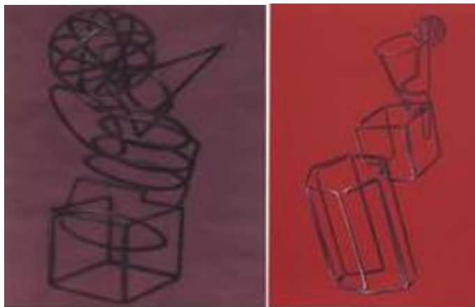
Рисунок 2. Пример практического задания: Тема: Изображение объемно-пластической композиции из геометрических тел (врезка) с помощью имитации проволочной конструкции.

Методические указания: Исследовать пространственное сочетание всех элементов конструкции непрерывной линией, графически фиксируя начало, и конец проволоки, а также все узловыe элементы.