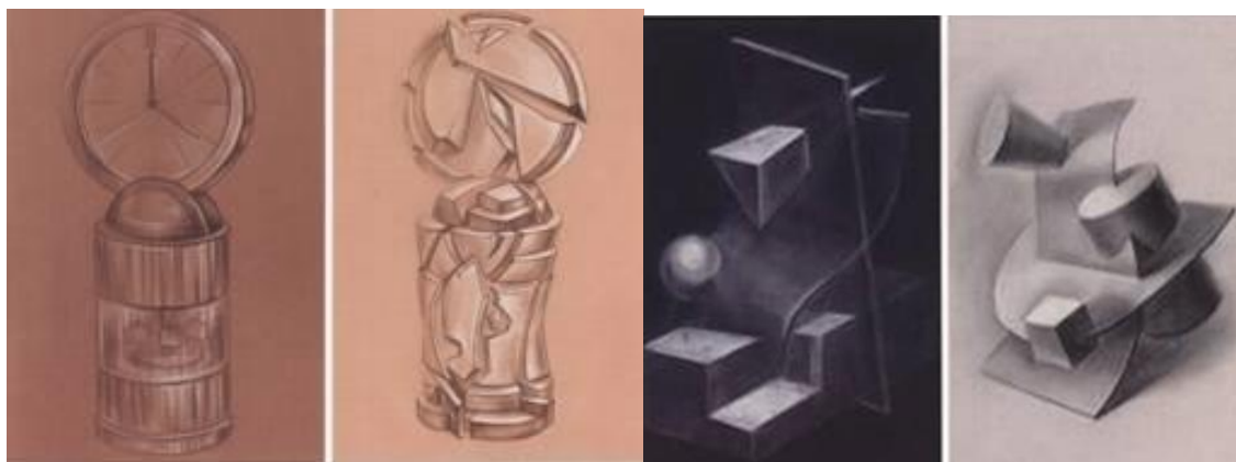
Рисунок 6. Пластическая форму, представляющая собой преобразование реального бытового предмета в объект, состоящий из геометрических тел. Объект, состоящий из геометрических тел, должен сохранять узнаваемость своего прототипа. Выявить структурное членение при сохранении целостного восприятия геометрии формы.