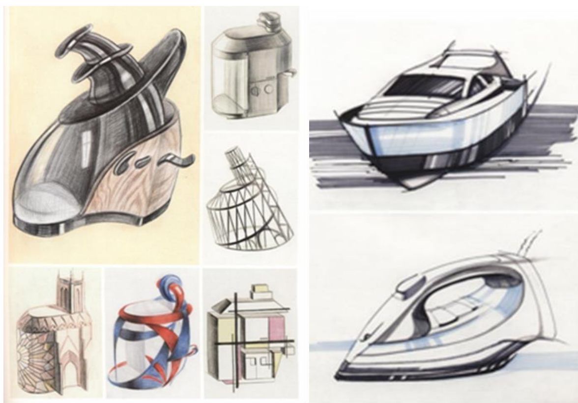
Рисунок 4. Трансформация формы художественно-промышленного изделия в различных стилях изобразительного искусства, архитектуры и дизайна

Подготовить материал к практическим занятиям по трансформации формы художественно-промышленного изделия в различных стилях изобразительного искусства. Выполнить линейную клаузуру на произведение дизайна (перевод реалистичного объекта в формальный с сохранением структурного единства на передачу эмоционального состояния через характеристики линий) в соответствии с индивидуальными ощущениями. Обосновать специфику изображения.