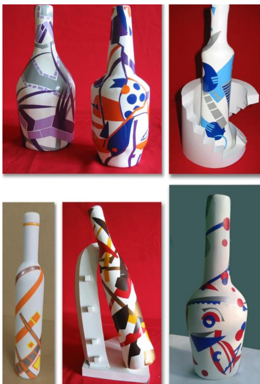
Рисунок 5. Работа формальной композиции на сложной объёмной форме криволинейной поверхности.

Для вырезания бумаги важно выбрать хорошие острые ножницы. Лезвия ножниц должны свободно раздвигаться, но не болтаться на скрепляющем винте. Но самым основным инструментом для резки бумаги все же является нож со специальной острой заточкой. Наиболее применяемым приспособлением, используемым в качестве основы под бумагу, во время ее порезки является обресток стекла, т.к. именно при работе по стеклу можно обеспечить идеально чистый срез края бумаги. Большое значение при выполнении работы имеет качество клея. Самым удобным и лучшим для работы является синтетический клей ПВА, а так же клей - карандаш. Чертежные инструменты. При разметке будущей композиции понадобятся простейшие инструменты: циркуль, линейка, карандаш. Папье-маше. Материалы и инструменты для работы. Бумага для папье-маше. Клейстер. Варианты его приготовления. Способы и приемы изготовления изделий в технике папьемаше. Технология выполнения форм для изделий. Краски, используемые для росписи изделий. Узоры и орнаменты. Растительные и геометрические орнаменты. Роспись городецкая, дымковская, хохломская. Кисти. Лаки. Технология нанесения лаков. Практика: Изготовление изделий по готовой форме (декоративное блюдо, вазы, карандашница, пасхальное яйцо и т.д.). Лепка форм. Выполнение изделий по предварительно изготовленной форме (маски, копилки и т.д.). Упражнения по росписи изделий. Роспись плоских и объемных изделий.