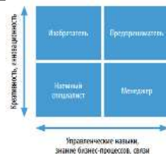
Рис. Матрица «Креативность – управленческие навыки»

3. Проанализируйте и сравните, какое влияние на существующие рынки оказывают радикальные (базисные) и улучшающие (поддерживающие) инновации. Охарактеризуйте инновации, приведенные ниже, в зависимости от глубины вносимых изменений: