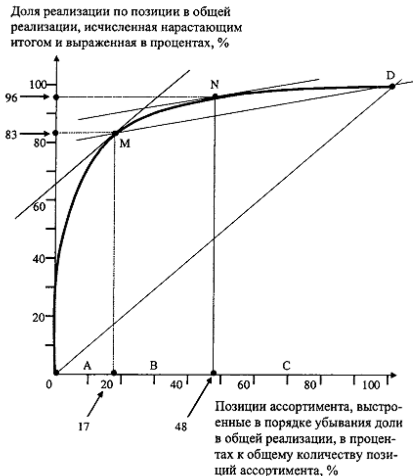
Рис. 2. Разделение исследуемого множества на группы А, В и С с помощью касательной к кривой ABC

Примечание. Разделение ассортимента па группы А, В и С может быть выполнено также методом, предложенным автором практикума. Границами групп, согласно этому методу, принимаются участки графика, на которых происходит резкое изменение кривизны линии ABC. Именно эти участки показывают, что область резкого нарастания накопленной позициями доли в реализации (начальный спрямленный участок графика, большие радиусы кривизны - группа А) закончилась и началась область плавного нарастания признака (средняя часть графика, малые радиусы кривизны - группа В). Границей между группами В и С является переход от области плавного нарастания накопленной доли в реализации к области крайне медленного нарастания признака (конечный спрямленный участок графика, вновь большие радиусы кривизны - группа С).