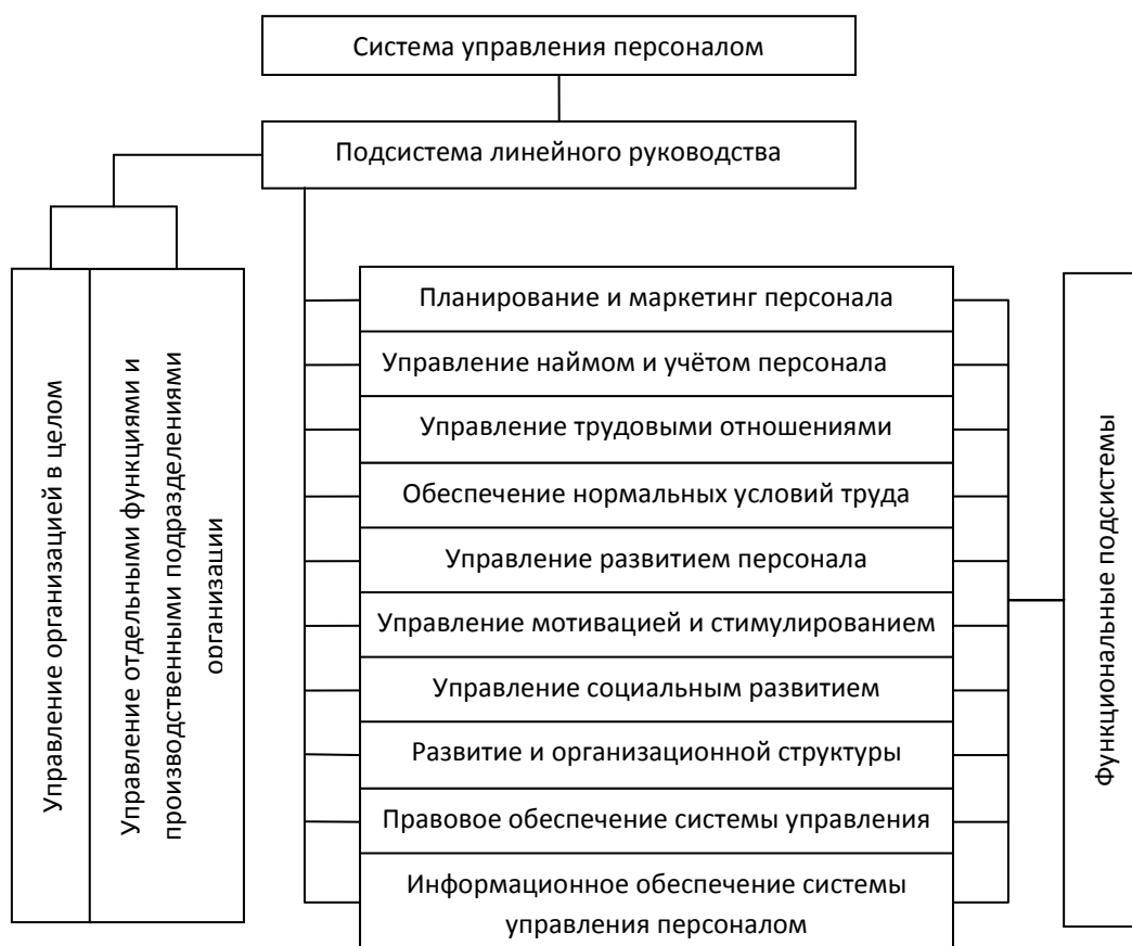
Рис.1. Состав подсистемы управления персоналом организации