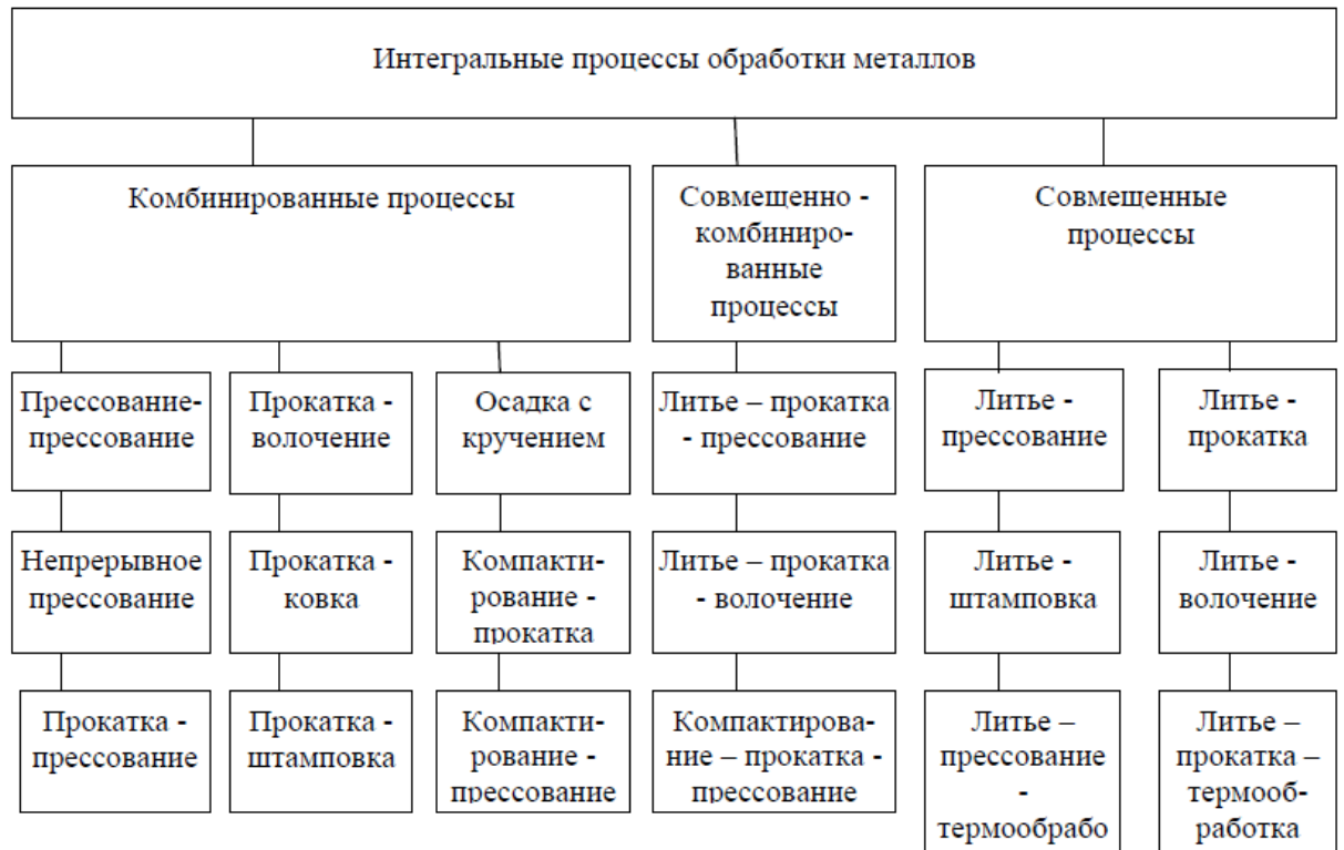
Рис. 2. Структурная схема процессов обработки металлов