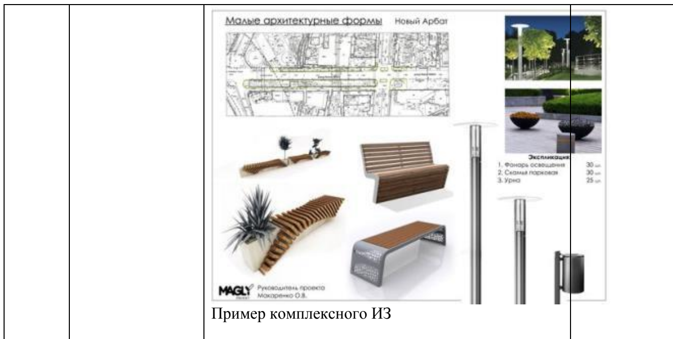
Пример комплексного ИЗ