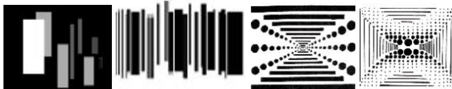
Рис.1. Упражнения на ритмическую композицию

Метрический ритм самый простой — размеры элементов и размеры пробелов одинаковы. Для выполнения метрической композиции можно вырезать черный прямоугольник, а элементами композиции будут линии или точки (Рисунок 1.). Роль линии будут играть бумажные полоски разной ширины, заготовленные с помощью резака. Точки — разного диаметра окружности. Работать с линией очень интересно. Надо помнить о том, что линия может делить пространство, а может его объединять. Можно выполнить метрическую композицию, используя только круги и точки.