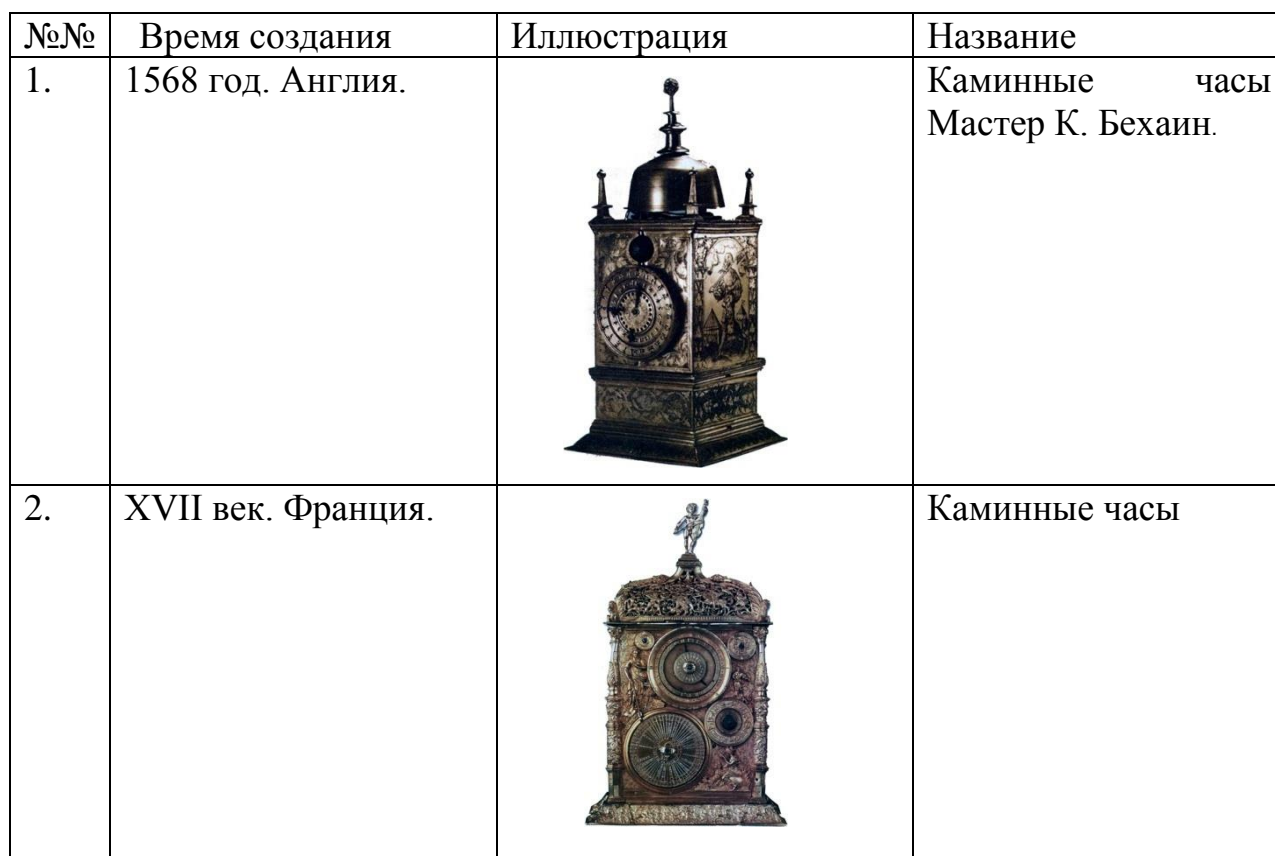
Таблица первая: историческая хронология

В начальной стадии составления классификационной таблицы рекомендуется наряду с главными характеристиками изделия, собирать и другую информацию, которая возможно потребуется в последующих размышлениях. Чаще всего это название, автор, размеры и материалы, особенно там, где они зафиксированы историками или искусствоведами.