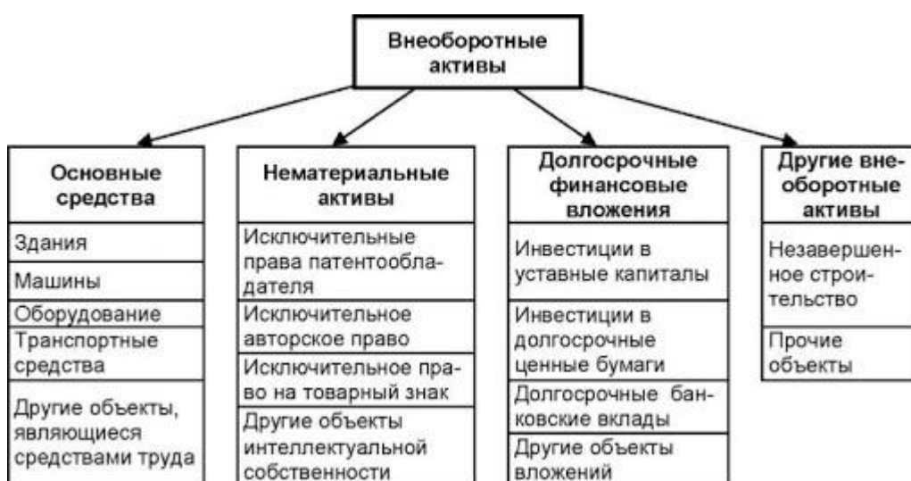
Рисунок 1 - Название рисунка

Рисунки, схемы, графики подписываются внизу по центру по образцу (рис. 1):