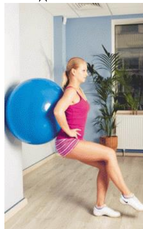
Рис.28Рис. 29Рис. 30