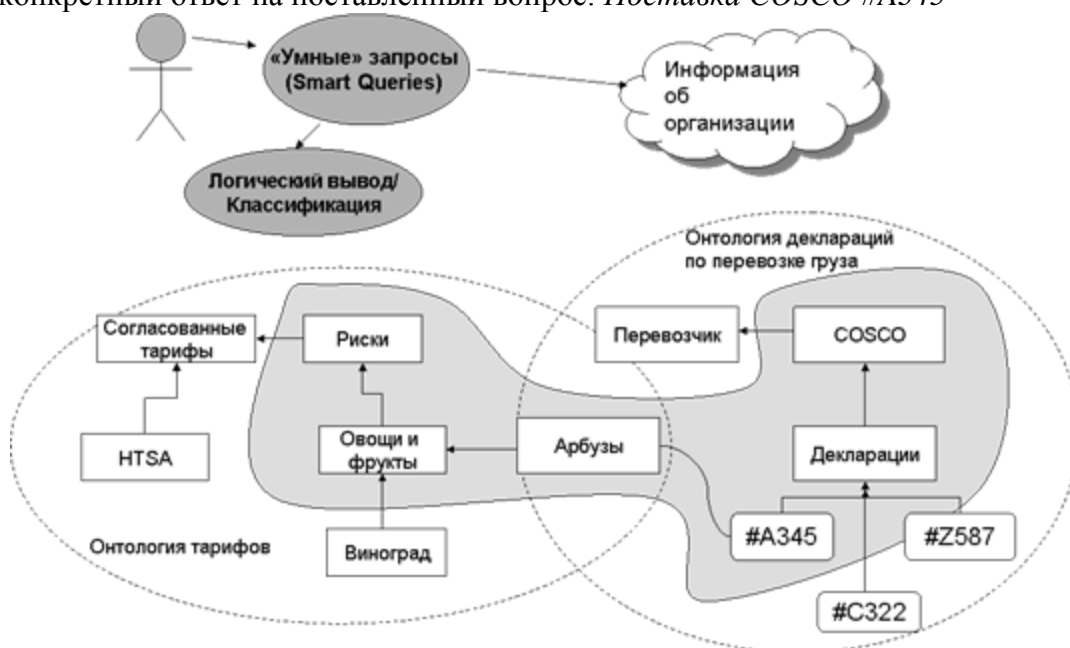
Рисунок 3 Интеллектуальный поиск на основе логического вывода

Также онтологии дают возможность получения не заданных явно знаний из информационных хранилищ путем логического вывода - поиск «скрытой информации». Например, пользователь системы может задать вопрос: Какие поставки продукции находятся сейчас в состоянии риска? В ответ на такой вопрос система в одной онтологии тарифов определит, что с учетом текущих условий (например, географических или погодных) существуют риски связанные с перевозкой овощей и фруктов. А в другой базе или онтологии деклараций по перевозке груза определит, что в декларации №А345 указаны арбузы, которые являются подклассом «Овощей и фруктов» (рис. 3). В результате, система сможет дать конкретный ответ на поставленный вопрос: Поставка COSCO #А345