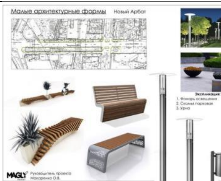
Пример работы (комплексное ИЗ)

производственно й практике; – навыками и методиками обобщения результатов решения, экспериментальн ой деятельности в области защиты интеллектуальн ых прав; – способами оценивания значимости и практической пригодности полученных результатов; – возможностью междисциплина рного применения знаний по дисциплине; – основными методами исследования в области защиты интеллектуальн ых прав, практическими умениями и навыками их использования; – основными методами решения задач в области защиты интеллектуальн ых прав; – способами совершенствова ния профессиональн ых знаний и умений путем использования возможностей информационно й среды.