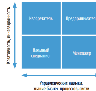
Рис. Матрица «Креативность – управленческие навыки»

3. Проанализируйте и сравните, какое влияние на существующие рынки оказывают радикальные (базисные) и улучшающие (поддерживающие) инновации.