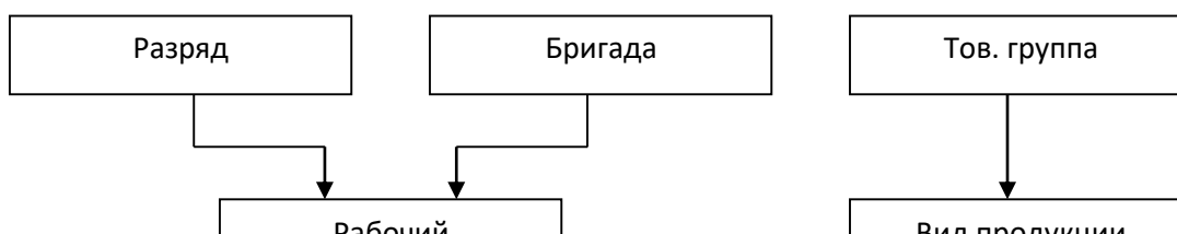
Схема структуры предметной области по учету производства продукции