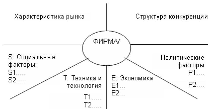
Рис. - Управленческая STEER-матрица.