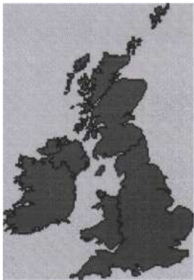
The British Isles

8. What are the capitals of the British Isles, Great Britain, the UK?