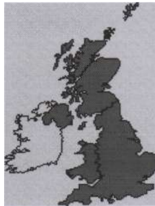
The United Kingdom