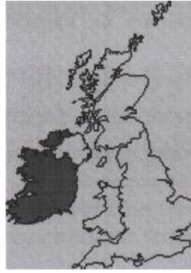
Republic of Ireland