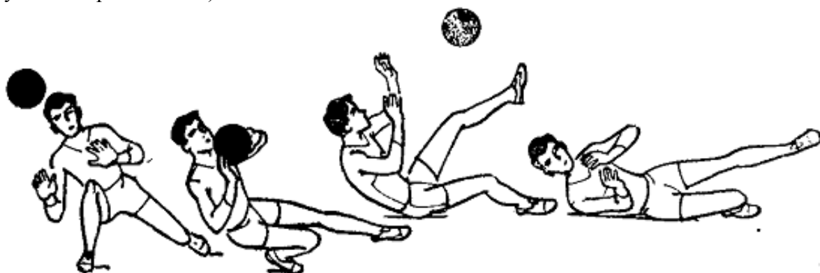
Рисунок - 2

Опытные волейболисты для увеличения радиуса действий в момент приседания не опускаются на пятку, а разгибают опорную ногу в колене, что обеспечивает дальность перемещения. Так можно делать только тогда, когда игрок опустился достаточно низко и перемещение его происходит над самым полом (разгибание ноги вверх опасно для последующего приземления).