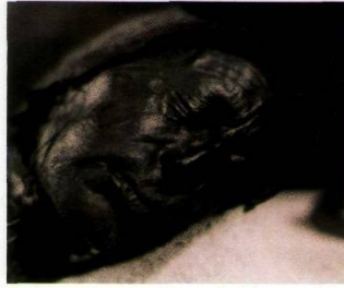
Der Tollund-Mann, ein Germane, der vor mehr als zweitausend Jahre hingerichtet, in einem Moor versenkt und so konserviert wurde. Der Name des Fundorts Tollund oder Torlund bedeutet: der Hain des Gottes Thor. Im Magen des Mannes fanden sich sedierend wirkende Kräuter, die ihn wohl ruhigstellen sollten. Ein Strick um seinen Hals weist auf Tod durch Erdrosseln hin.

ihm einen besonderen Tag: den Donnerstag (engl. Thursday). Der Freitag erinnert an Freya , die unbeschreiblich schöne Göttin der Liebe. Sie konnte die Zukunft vorhersagen.