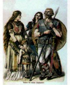
Germanen - Darstellung aus dem 19. Jahrhundert

Vor zweitausend Jahren wohnten nordöstlich des Rheins die Germanen. Sie lebten auf einzelnen Höfen oder in kleinen Dörfern als Großfamilien. Aus ihrer germanischen Sprache wurde dann Deutsch (und auch Schwedisch, Dänisch, Holländisch, Englisch). Während der Völkerwanderungszeit im Frühmittelalter zogen germanische Stämme in gewaltigen Trecks oft kreuz und quer nach Süden und gründeten von Andalusien über Nordafrika bis ans Schwarze Meer neue Reiche, so dass am Ende der Epoche, im Hochmittelalter, die meisten Fürstentümer Europas germanischen Ursprungs waren.