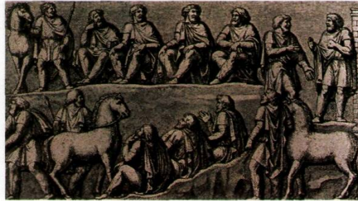
Zeitgenössische Darstellung: Relief an der Marc-Aurel-Säule in Rom: Germanische Ratsversammlung (Thing) - diese „Regierungsform“ hat sich an einigen schweizerischen Orten als „Landsgemeinde“ erhalten.

Neben der reichen Oberschicht, den Edlen (Adeligen), gab es die freien Bauern . Knechte mussten für sie arbeiten. Dies waren oft Kriegsgefangene, die von Raubzügen mitgebracht wurden. Wichtige Entscheidungen trafen die waffenfähigen Männer an der Volkversammlung .