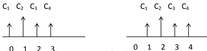
Рис. 1. Типы денежных потоков пренумерандо и постнумерандо

Срок окупаемости инвестиций – это срок, в течение которого, инвестор полностью возвратит первоначальные инвестиции.