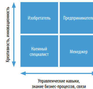
Рис. Матрица «Креативность – управленческие навыки»

ответственность; -отношение к организационной структуре.