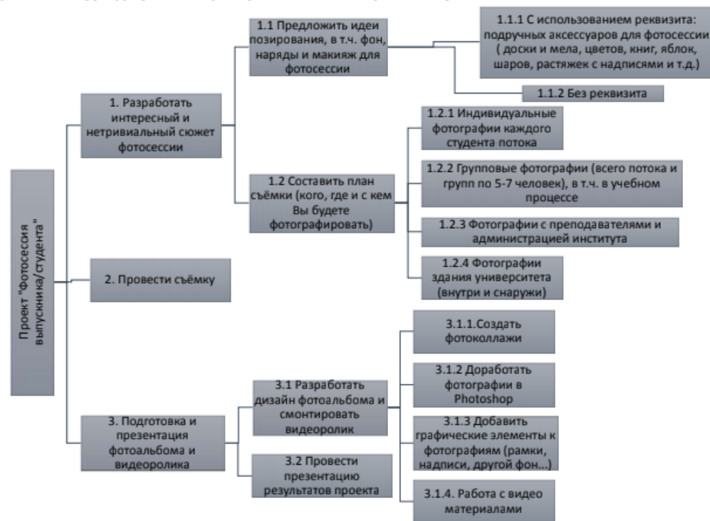
Рисунок 1. Иерархическая структура работ по проекту "Фотосессия выпускника/студента"

Каждая команда должна будет создать и представить конкурсному жюри электронную или бумажную версию выпускного фотоальбома и видеоролик как результаты этого проекта. При реализации проекта каждый участник команды должен выполнять определённую роль, например, менеджера проекта, фотографа, дизайнера и т.д.