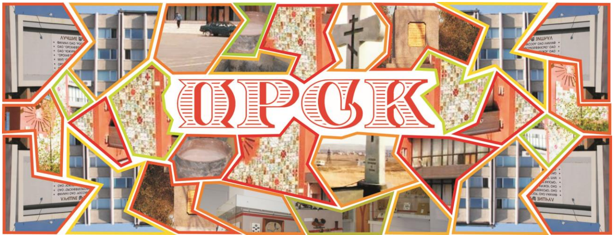
Обработка в графическом редакторе. Наклейка на кружку.