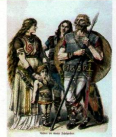
Germanen - Darstellung aus dem 19. Jahrhundert

Vor zweitausend Jahren wohnten nordöstlich des Rheins die Germanen. Sie lebten auf einzelnen Höfen oder in kleinen Dörfern als Großfamilien. Aus ihrer germanischen Sprache wurde dann Deutsch (und auch Schwedisch, Dänisch, Holländisch, Englisch). Während der Völkerwanderungszeit im Frühmittelalter zogen germanische Stämme in gewaltigen Trecks oft kreuz und quer nach Süden und gründeten von Andalusien über Nordafrika bis ans Schwarze Meer neue Reiche, so dass am Ende der Epoche, im Hochmittelalter, die meisten Fürstenhäuser Europas germanischen Ursprungs waren.