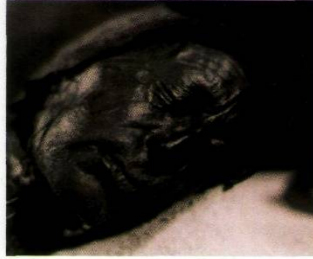
Der Tollund-Mann, ein Germane, der vor mehr als zweitausend Jahre hingerichtet, in einem Moor versenkt und so konserviert wurde. Der Name des Fundorts Tollund oder Torlund bedeutet: der Hain des Gottes Thor. Im Magen des Mannes fanden sich sedierend wirkende Kräuter, die ihn wohl ruhigstellen sollten. Ein Strick um seinen Hals weist auf Tod durch Erdrosseln hin.

ihm einen besonderen Tag: den Donnerstag (engl. Thursday). Der Freitag erinnert an Freya , die unbeschreiblich schöne Göttin der Liebe. Sie konnte die Zukunft vorhersagen.