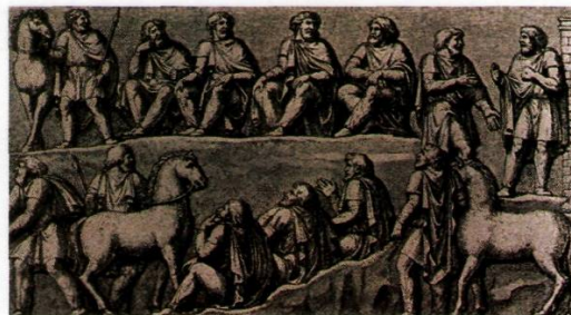
Zeitgenössische Darstellung: Relief an der Marc-Aurel-Säule in Rom: Germanische Ratsversammlung (Thing) - diese „Regierungsform“ hat sich an einigen schweizerischen Orten als „Landsgemeinde“ erhalten.

Eigentliche germanische Städte gab es keine. Die Germanen lebten in großen Familien , den Sippen, in Dorf- oder Talgemeinschaften. Sie hatten lange eine Abneigung gegen Steinbauten; erst im 12. Jahrhundert errichteten die Adelligen (die Ritter) Burgen aus Stein. Neben der reichen Oberschicht, den Edlen (Adeligen), gab es die freien Bauern . Knechte