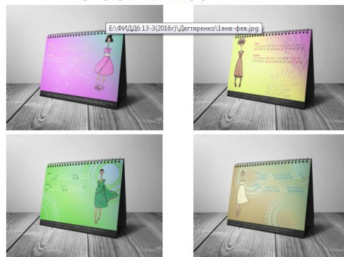
Примеры работ студентов графического дизайна

Комплексное задание. Выполнение проектов (свой дизайн-проект календаря) на основе исторически сложившихся стилей