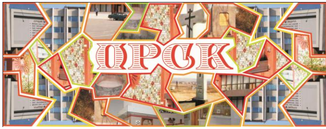
Обработка в графическом редакторе. Наклейка на кружку.