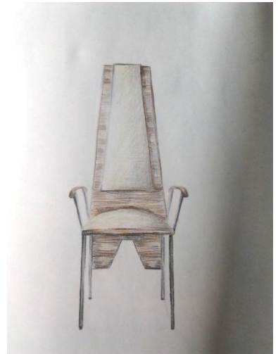
Из Глоссарий по истории мебели