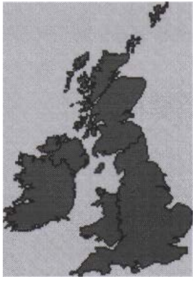
The British Isles