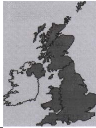
The United Kingdom