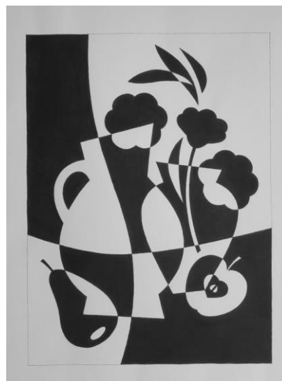
Пример выполнения задания №7: Оверлеппинг и его роль в композиции