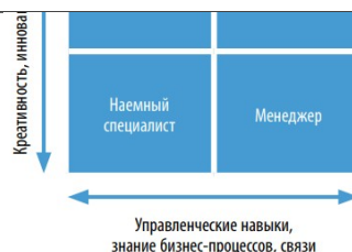
Рис. Матрица «Креативность – управленческие навыки»

3. Проанализируйте и сравните, какое влияние на существующие рынки оказывают радикальные (базисные) и улучшающие (поддерживающие) инновации. Охарактеризуйте инновации, приведенные ниже, в зависимости от глубины вносимых изменений: