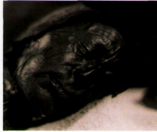
Der Tollund-Mann, ein Germane, der vor mehr als zweitausend Jahre hingerichtet, in einem Moor versenkt und so konserviert wurde. Der Name des Fundorts Tollund oder Torlund bedeutet: der Hain des Gottes Thor. Im Magen des Mannes fanden sich sedierend wirkende Kräuter, die ihn wohl ruhigstellen sollten. Ein Strick um seinen Hals weist auf Tod durch Erdrosseln hin.

ihm einen besonderen Tag: den Donnerstag (engl. Thursday). Der Freitag erinnert an Freya , die unbeschreiblich schöne Göttin der Liebe. Sie konnte die Zukunft vorhersagen.