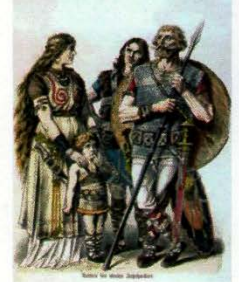
Germanen - Darstellung aus dem 19. Jahrhundert

Vor zweitausend Jahren wohnten nordöstlich des Rheins die Germanen. Sie lebten auf einzelnen Höfen oder in kleinen Dörfern als Großfamilien. Aus ihrer germanischen Sprache wurde dann Deutsch (und auch Schwedisch, Dänisch, Holländisch, Englisch). Während der Völkerwanderungszeit im Frühmittelalter zogen germanische Stämme in gewaltigen Trecks oft kreuz und quer nach Süden und gründeten von Andalusien über Nordafrika bis ans Schwarze Meer neue Reiche, so dass am Ende der Epoche, im Hochmittelalter, die meisten Fürstentümer Europas germanischen Ursprungs waren.