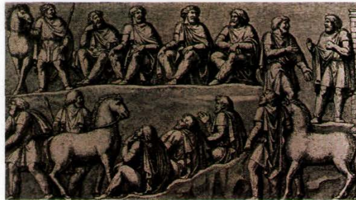
Zeitgenössische Darstellung: Relief an der Marc-Aurel-Säule in Rom: Germanische Ratsversammlung (Thing) - diese „Regierungsform“ hat sich an einigen schweizerischen Orten als „Landsgemeinde“ erhalten.

Neben der reichen Oberschicht, den Edlen (Adeligen), gab es die freien Bauern . Knechte mussten für sie arbeiten. Dies waren oft Kriegsgefangene, die von Raubzügen mitgebracht wurden. Wichtige Entscheidungen trafen die waffenfähigen Männer an der Volksversammlung .