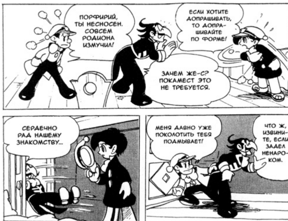
Рисунок А.1 – Манга О. Тэдзуки «Преступление и наказание». Эпизод «Порфирий пришёл в комнату Раскольникова»

Примечание: за выполнение технических требований к оформлению ВКР отвечает студент! Научный руководитель, проводит проверку на соответствие техническим требованиям перед подготовкой итогового варианта работы к передаче на проверку нормоконтролеру кафедры.