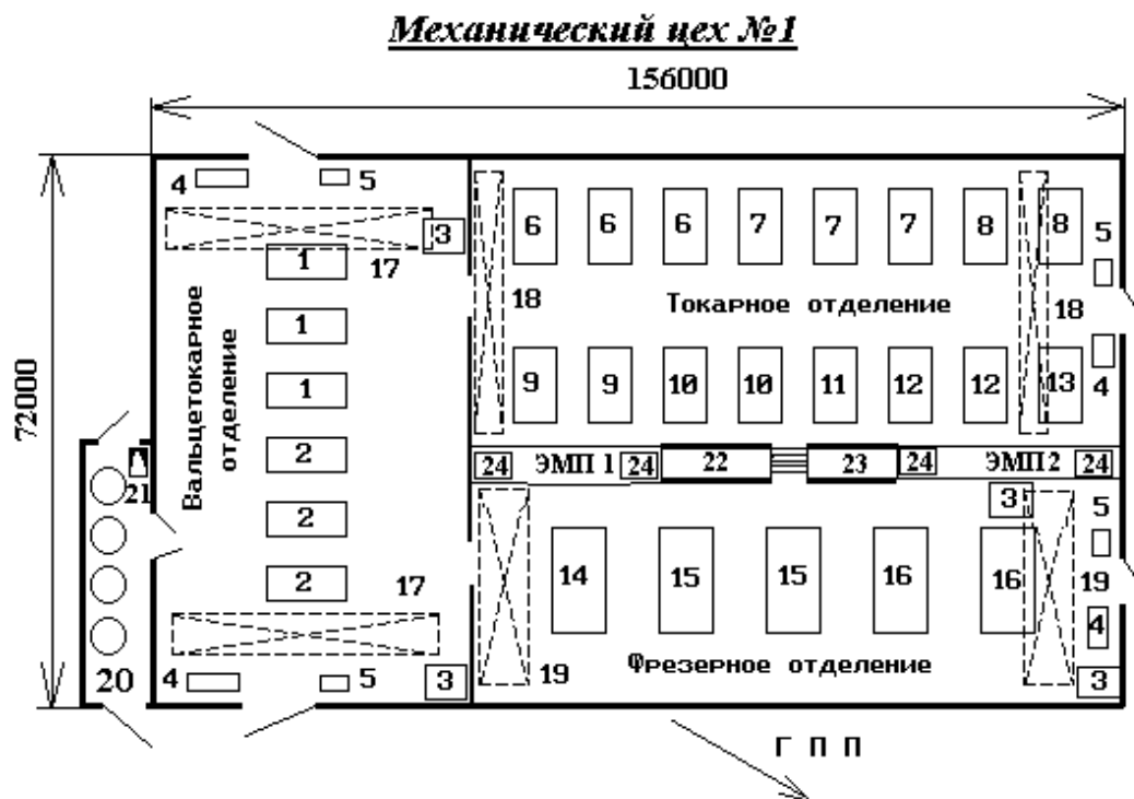
Ведомость электроприемников Объект: Механический цех №1