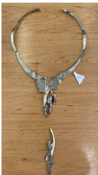
Рисунок 1. Исходное состояние колье «Город» с обнаруженными дефектами