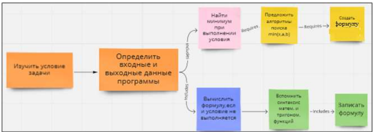
Рис. 1. Пример концептуальной схемы