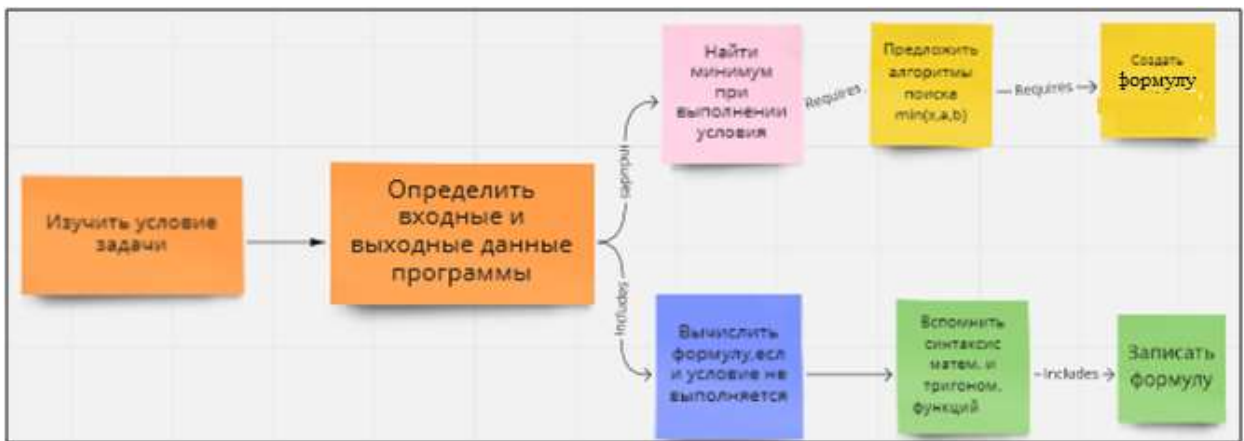
Рис. 1. Пример концептуальной схемы