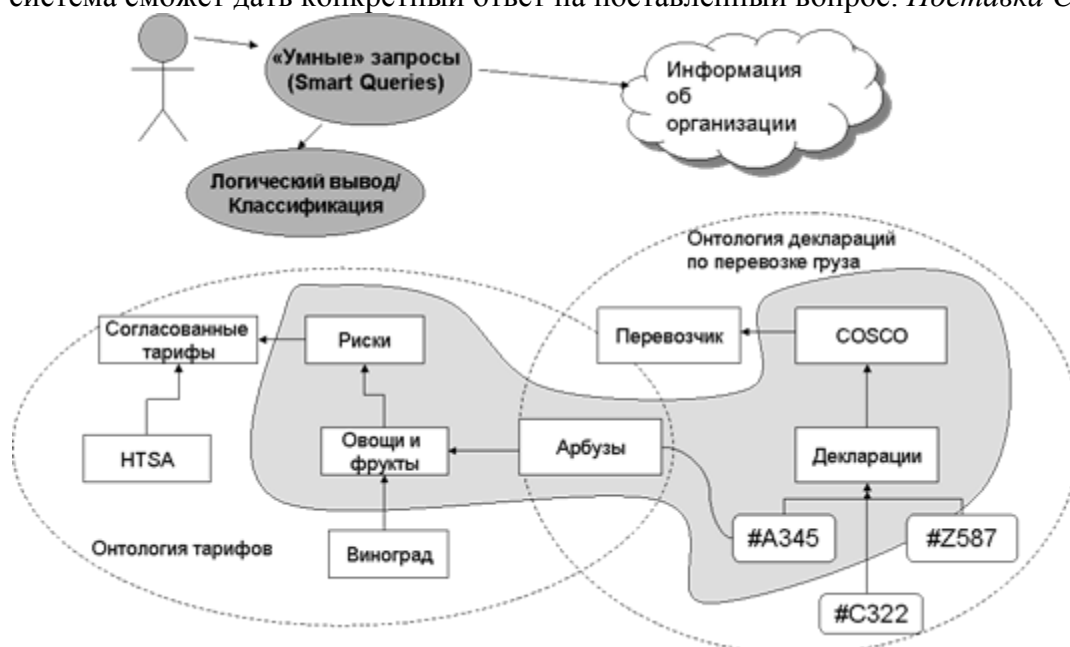
Рисунок 3 Интеллектуальный поиск на основе логического вывода

Например, пользователь системы может задать вопрос: Какие поставки продукции находятся сейчас в состоянии риска? В ответ на такой вопрос система в одной онтологии тарифов определит, что с учетом текущих условий (например, географических или погодных) существуют риски связанные с перевозкой овощей и фруктов. А в другой базе или онтологии деклараций по перевозке груза определит, что в декларации №А345 указаны арбузы, которые являются подклассом «Овощей и фруктов» (см. рис. 3). В результате, система сможет дать конкретный ответ на поставленный вопрос: Поставка COSCO #А345