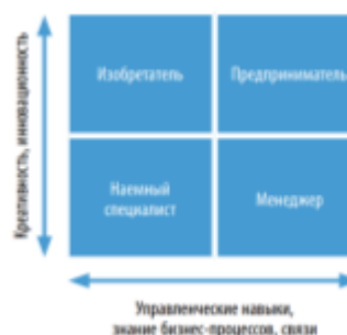
Рис. Матрица «Креативность – управленческие навыки»

3. Проанализируйте и сравните, какое влияние на существующие рынки оказывают радикальные (базисные) и улучшающие (поддерживающие) инновации. Охарактеризуйте инновации, приведенные ниже, в зависимости от глубины вносимых изменений: