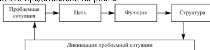
Рис.2. Возникновение целей

• Цель представляет собой состояние, к которому направлена тенденция движения объекта. В неживой природе существуют объективные цели, а в живой дополнительно - субъективные цели. Образно говоря, объективная цель - это мишень для поражения, а субъективная цель - желание стрелка поразить ее. Цель обычно возникает из проблемной ситуации, которая не может быть разрешена наличными средствами. И система с присущей ей или частично измененной структурой и функцией выступает средством разрешения проблемы. Схематично это представлено на рис. 2.