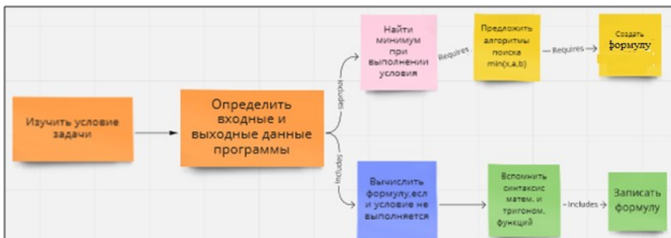
Рисунок 1 – Пример концептуальной схемы решения