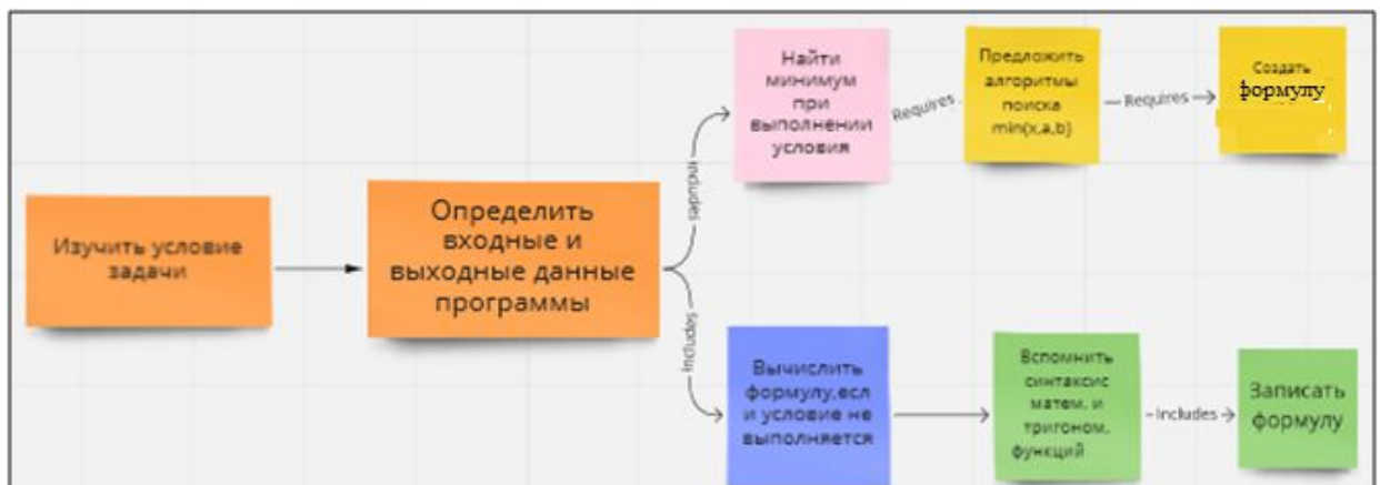
Рисунок 1 – Пример концептуальной схемы решения